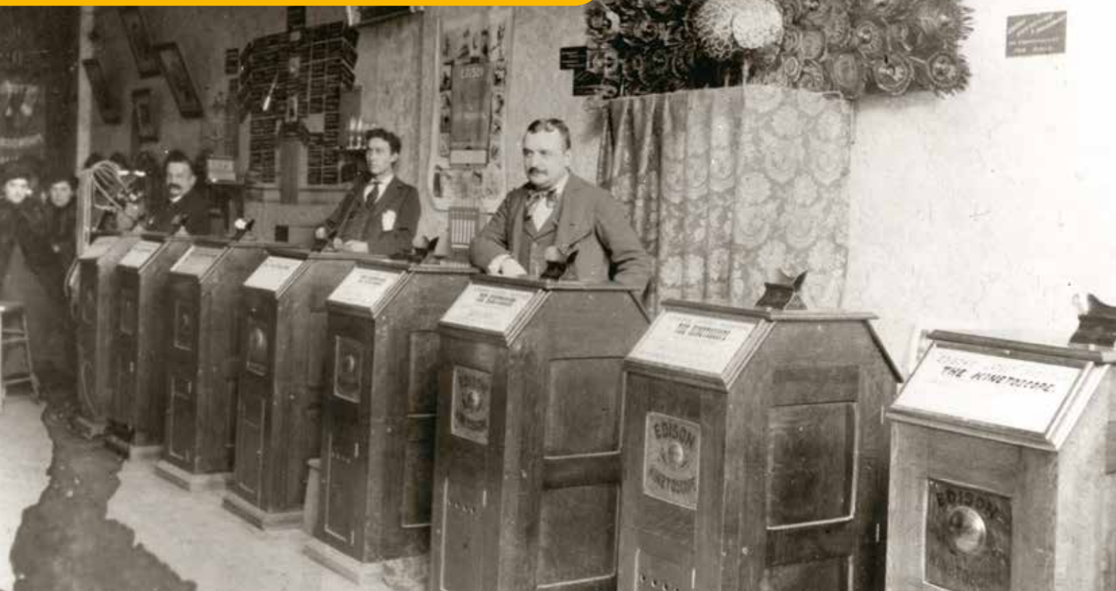
Acht kinetoscopen op een rij in een winkel of café, Christiania 1895.