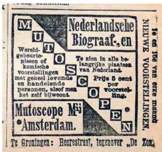
Advertentie in het Nieuwsblad van het Noorden van 22 februari 1900.