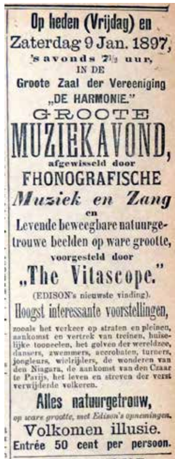
Advertentie Nieuwsblad van het Noorden van 9 januari 1897.

Terwijl een Duitse en een Franse projector Europa veroverden, had men ook in de Verenigde Staten van Amerika niet stil gezeten. Daar kwam een nieuw projectiesysteem op de markt. Op 9 januari 1897 beleefde de ‘Vitascope’ zijn primeur voor de Lage Landen in de Harmonie in Groningen. Tijdens een ‘grote muziekavond’, afgewisseld door ‘phonografische muziek en zang’, zouden levende beelden natuurgetrouw en op ware grootte