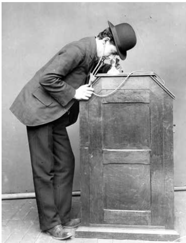
Kinetoscoop met kijker. Foto uit 1895 van een onbekende maker, ontleend aan www.retronaut.com .

Advertentie Provinciale Groninger Courant van 20 december 1895.